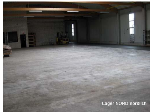
Lager NORD nördlich